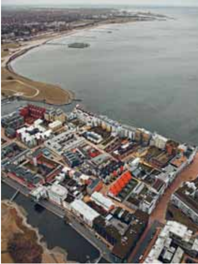
Boo1 blir början till bostadsbyggnandet i Västra hamnen.