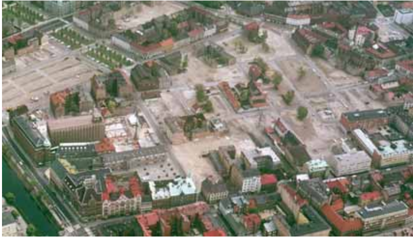
Stora delar av Lugnet revs under 1960- och 1970-talen och ersattes av ny bebyggelse.