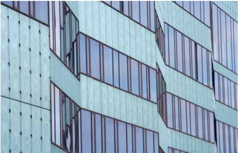
Malmö Högskola har förvandlat Malmö till en av Sveriges större universitetsstäder.