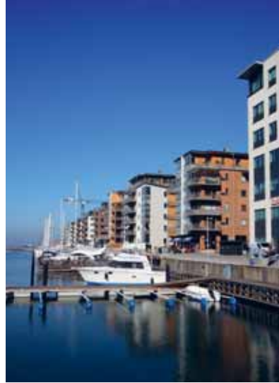
Kvarteren kring Dockan är storskaligare än Boo1:s fisknätsliknande stadsplan.