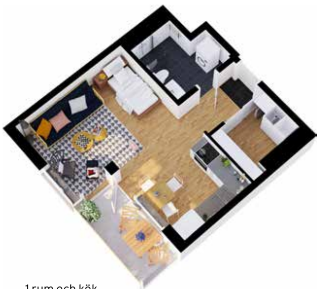
1 rum och kök