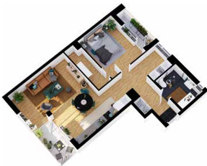
2 rum och kök