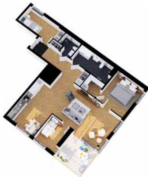
4 rum och kök Med reservation för viss avvikelse. Gäller alla planlösningar.