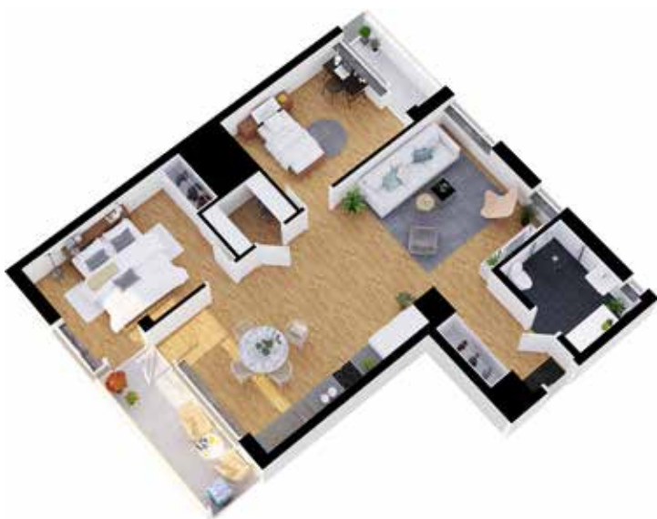
3 rum och kök