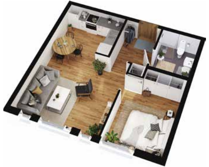
2 rum och kök