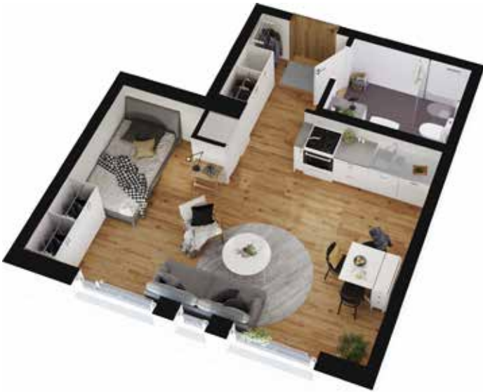
1 rum och kök