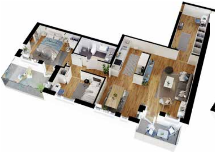
3 rum och kök