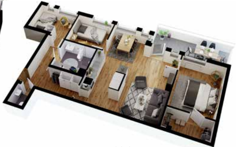
4 rum och kök