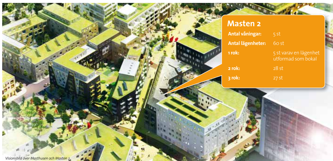
Visionsbild över Masthusen och Masten 2.

I Masthusen är det nära till både havet och stadspulsen. Du tar dig enkelt till Malmö Centralstation, en promenad på cirka 15 minuter eller en cykeltur på 5 minuter. Området trafikeras av tre stadsbusslinjer som avgår till- och från Malmö Centralstation var 5:e minut i högtrafik. Därifrån tar du dig smidigt vidare ut i Skåne eller över bron till Kastrup eller Köpenhamn.