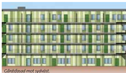
Gårdsfasad mot sydväst.