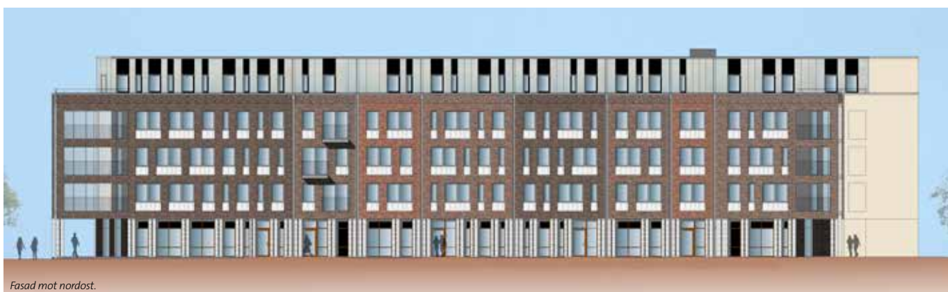
Fasad mot nordost.

Hemmet bestämmer ju den där känslan som ibland kan vara svår att sätta fingret på, känslan som sätter tonen för- och genomsyrar varje dagen. Som får dig att vakna på morgonen och må bra utan att egentligen veta varför. Ett eget hem att längta till. Det är med det i åtanke vi förvaltar och utvecklar boenden att trivas i. Vi formar nya stadsdelar och områden med levande miljöer, där boenden får växa fram tillsammans med arbetsplatser, service, handel och restauranger. Platser där folk mår bra.