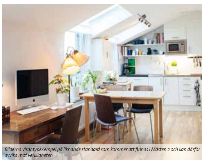
Bilderna visar typexempel på liknande standard som kommer att finnas i Masten 2 och kan därför avvika mot verkligheten.